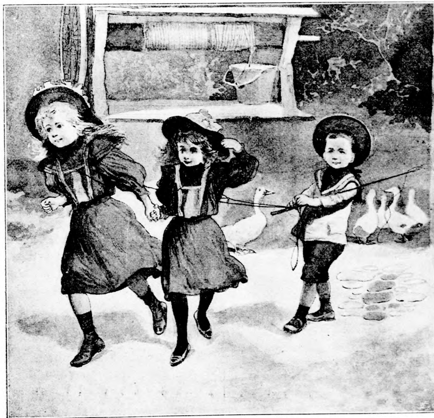
RÖPÜLJETEK . . . (Lásd a 342. lapon.)