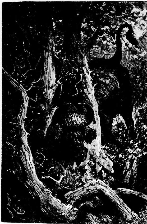
... A SZEGÉNY BÖLÉNY MEG VOLT FOGVA.

mozgásai a fát megrázták; de ha gyöke-restől tépte volna is ki, az állat helyzete nem javult volna. Akár állt, akár feküdt volna, a fa szorongatta zsákmányát és nem eresztette volna el.