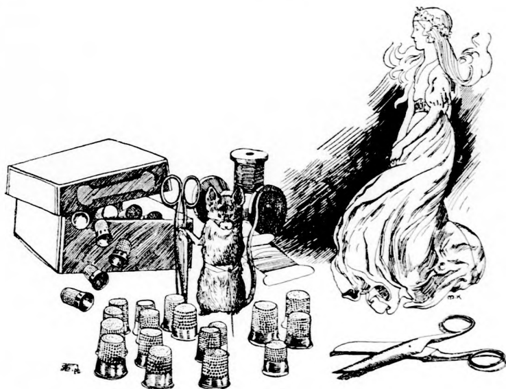
— JELENTEM ALÁSAN, KÉSZEN VAGYUNK! (Lásd a 126. lapon.)

— Ah! Végre a szép szabadság int felénk!