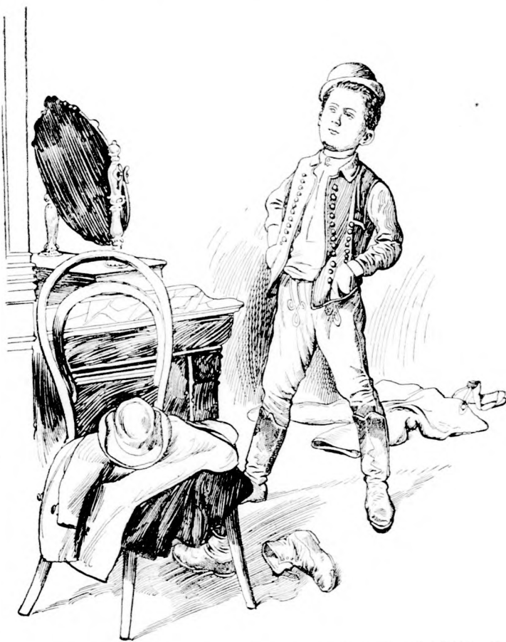
... FERKE NAGYON TETSZETT MAGÁNAK, MIKOR A TÜKÖRBE NÉZETT.

és elkérte tőle a Janesi gyerek ruháját. Aztán ebéd után rögtön felöltözködött paraszt-gyerekek, persze titokban, hogy senki meg ne lássa. Alig lehetett ráismerni, olyan szép lett. Mint ha megnőtt volna