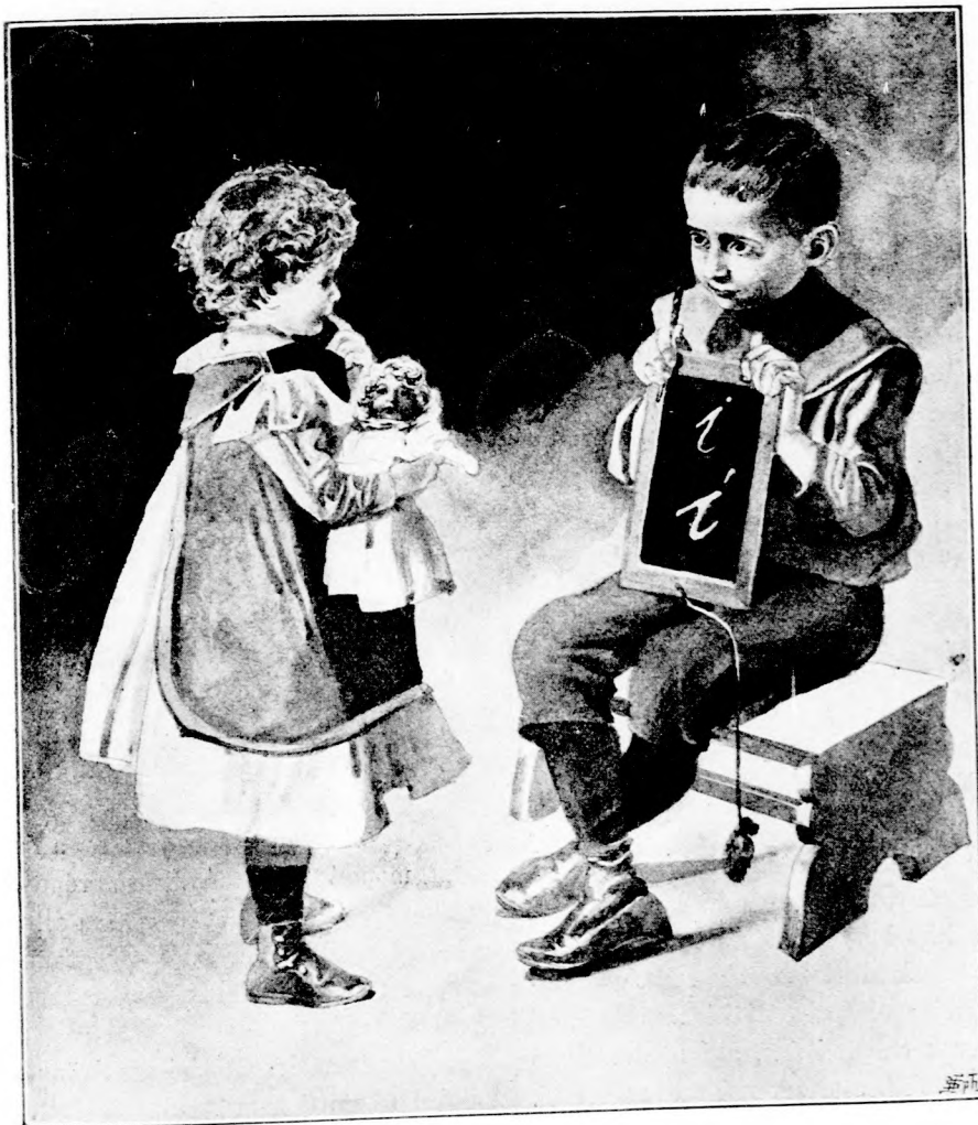
A KIS TUDÓS. (Lásd a 232. lapon.)

LXIII. köt. 15. szám. Ára negyedévre 2 kor. Egyes szám ára 24 fil. 1902. október 12-én. Megjelen minden vasárnap 16 lapon.