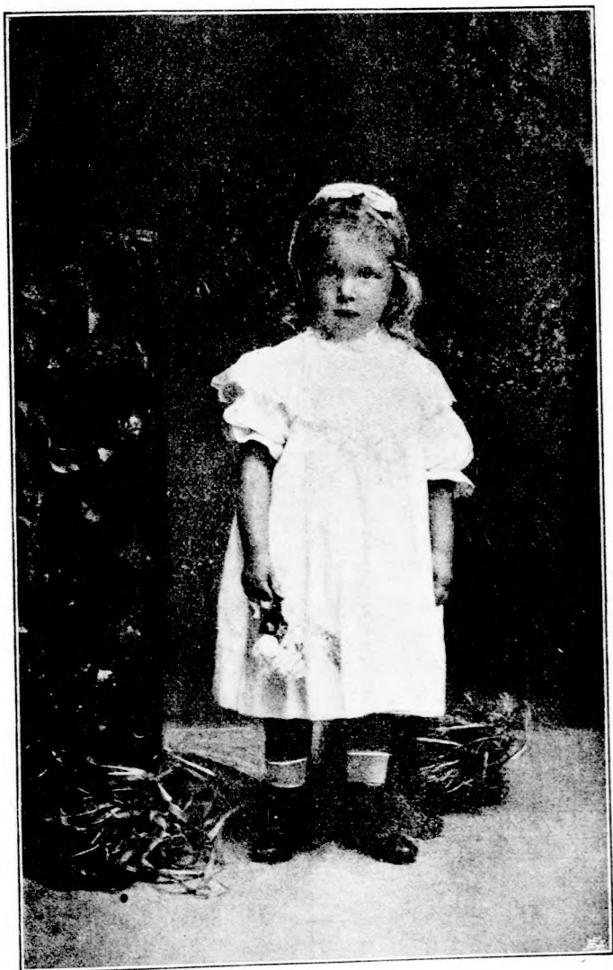
LUJZIKA KÖSZÖNTŐJE. (Lásd a 228. lapon.)