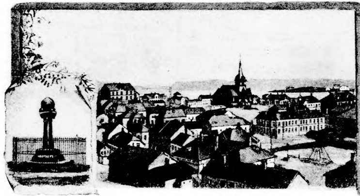
HAMMERFEST ÉS A DÉLKÖR-EMLEK.

A gőz a VI-ik században. Közönségesen azt hiszik, hogy Watt James és Caus Salamon ismerte föl először a gőz erejét. Pedig az igazság az, hogy már sok századdal előttük élt egy férfi, aki ismerte a gőzt és ha nem is tudta ismeretét hasznosan felhasználni: a róla szóló emlékek szerint mégis tudott vele bánni. Ez a férfi Anthimius , a VI-ik század híres szám-tudósa, vegyész és építő-mestere volt. Anthimius Konstantinápolyban Justinian római császár udvarában élt testvérével, Metrodorussal , a világ-hírű nyelvészszel s