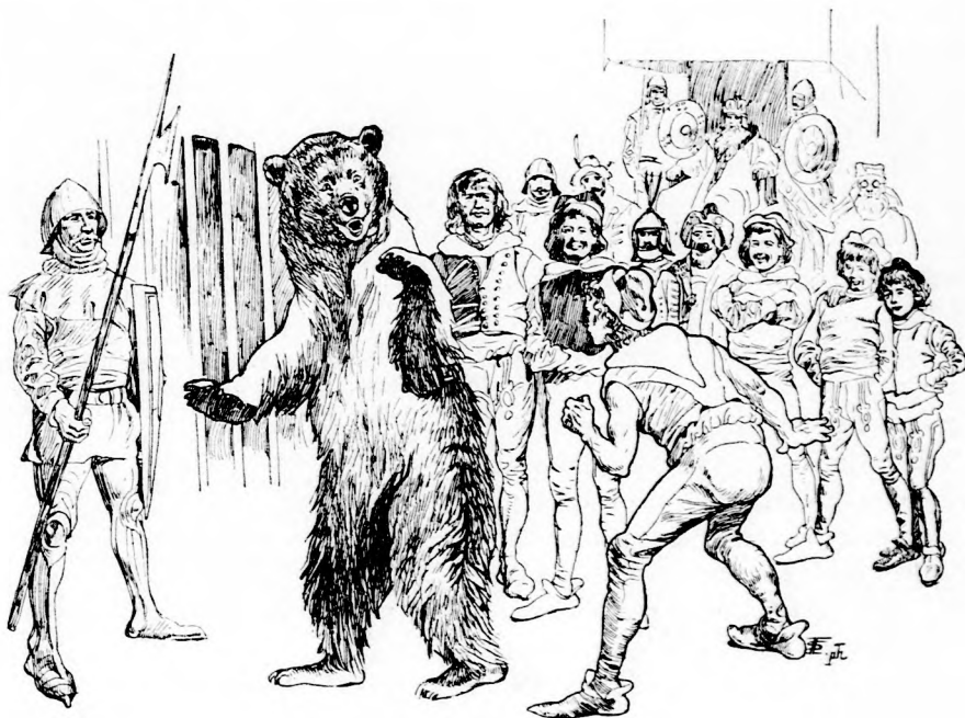
— HÁSZE, HA MEDVE, IDE VELE! — KIÁLTOTT BANDI.

— Egy óra se kell annak, szólt Jóska s csak tüszentett egyet, pedig csak kicsit . . . s lám, a házak is megintogtak;