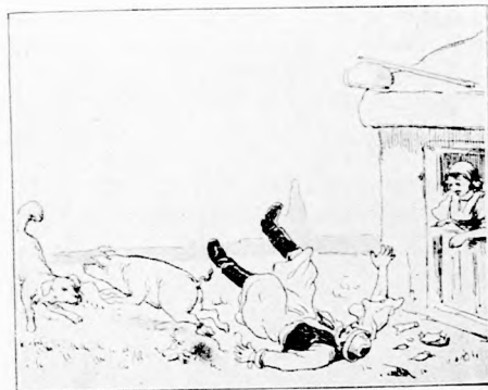
Malacz ugrik — gazduram hencseredik hátra... Száz darabban az üveg, úgy a földhöz vágta. Kocsmárosné asszonyomnál mégse vész az kárba: Drága lesz az áldomás, gondolja magába.