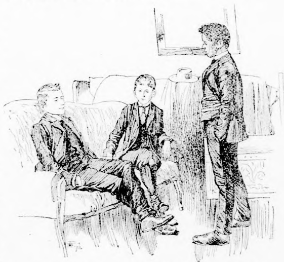
MÁLI NÉNINEK HÁROM KOSZTOS DIÁKJA.

Máli néni hagyta a fiukat verekedni. Husz esztendő alatt sok mindenféle verekezésben tett ő már igazságot, de még ilyen fura oka egyik verekezésnek sem volt.