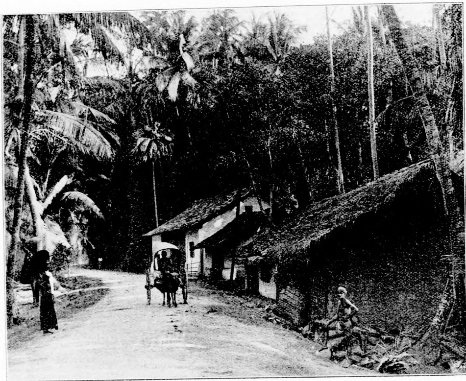
DZSUNGELBEN LEVŐ HÁZAK.

sem található egymás mellett annyi drága-kő, mint ennek a csodálatos szigetnek talajában. A lakosság fő jövedelmét a tea-ültetvények szolgáltatják. Sok hasznos hajt azonban a kókusz-fa, a kakaó, a kina-héj és egyéb ritka termék is. Nem jelentéktelen a gyöngy-halászat sem. Nem csak a városai, de falvai is érdekesek, mert gyönyörű fák árnyékolják be házaikat. Még az őserdőkben, az úgy-nevezett dzsungelekben is fellelhetők emberi lakások.