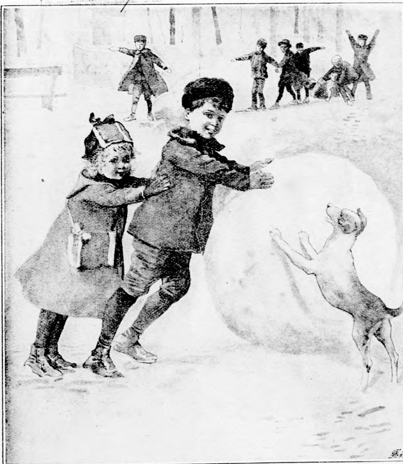
HÓ GOLYO. (Lásd a 7. lapon.)