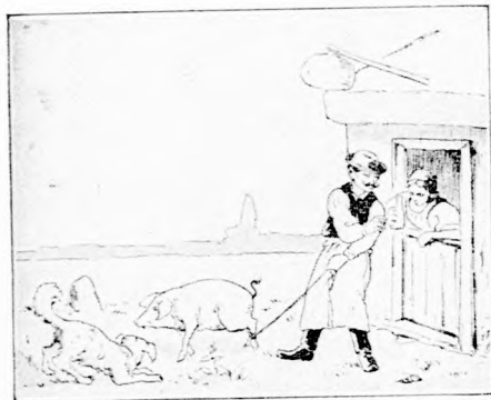
Gazduram a vásárról malacczal jön vissza. Kocsmához ér, az áldomást — gondolja — megissza.