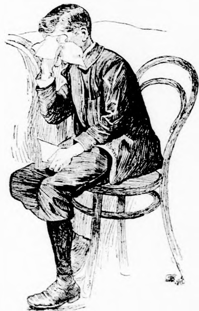
MIKOR PEDIG ELVÉGEZTE, HÁT OMLOTTAK A KÖNNYEI.