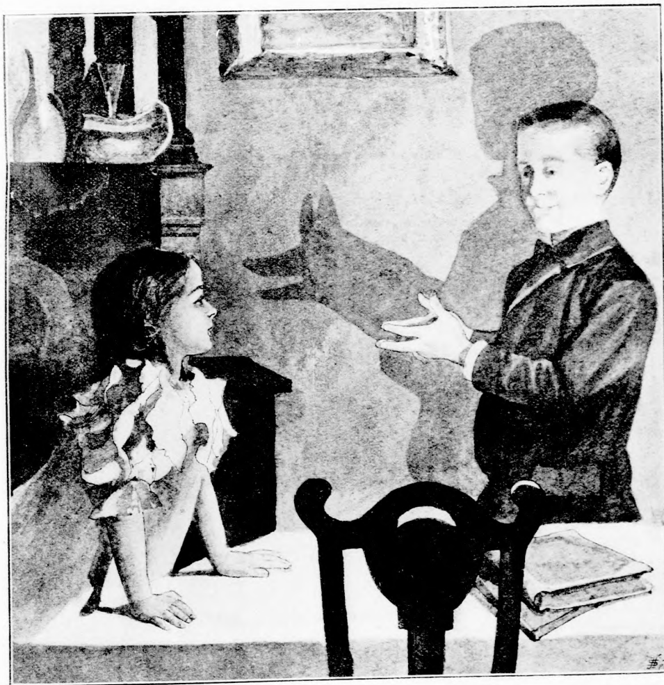
HOSSZU TÉLI ESTÉK . . . (Lásd a 19. lapon.)