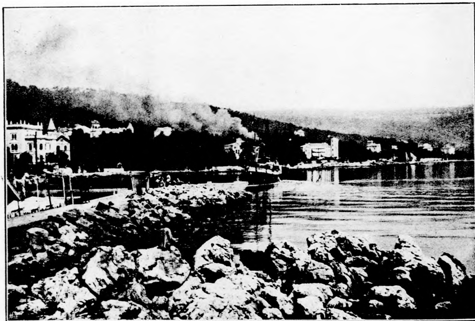
ABBZIA FÜRDŐHELY. (Lásd az 53. lapon.)