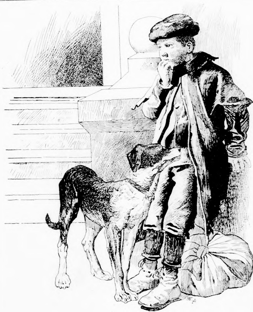
VÁNDOR-GYEREK. (Lásd az 52. lapon.)