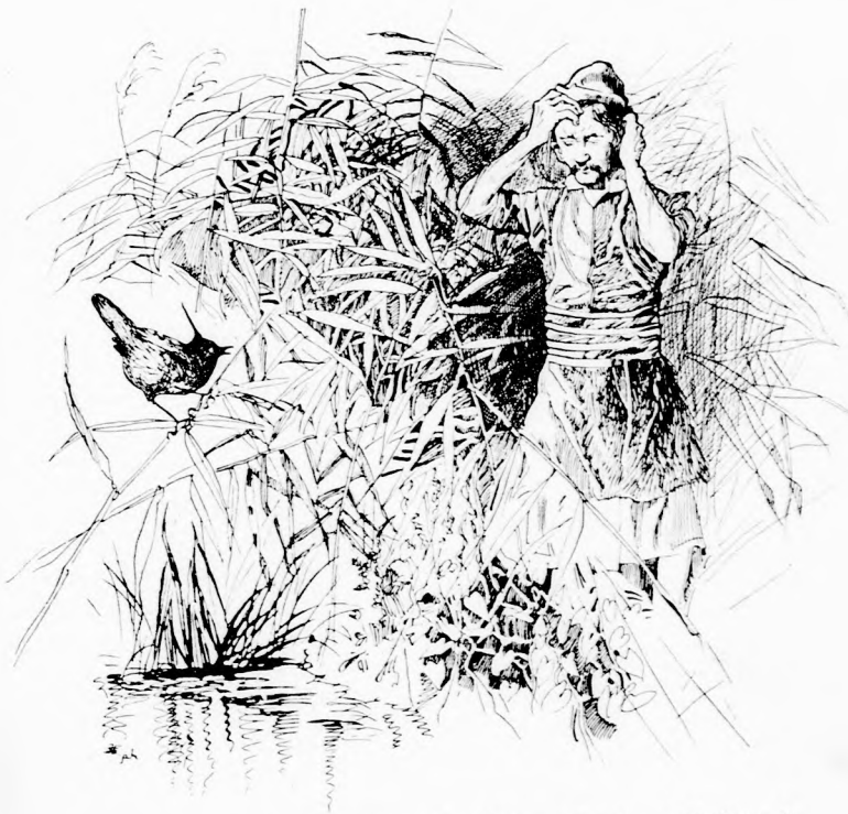
... RÁVISIT EGY NAGY FEJŰ BIBICZ. (Lásd az 58. lapon.)

— Fölséges király, éppen gátat emelünk, amoda le, a tocsogónál, ahol is parancsolta fölséged, mikor ez az ember betört birodalmadba. Szerencsére az egyik őrünk, a Hájfalat manó idejében meglátta őt és jelt adott. Mi azután lekötöttük az embert