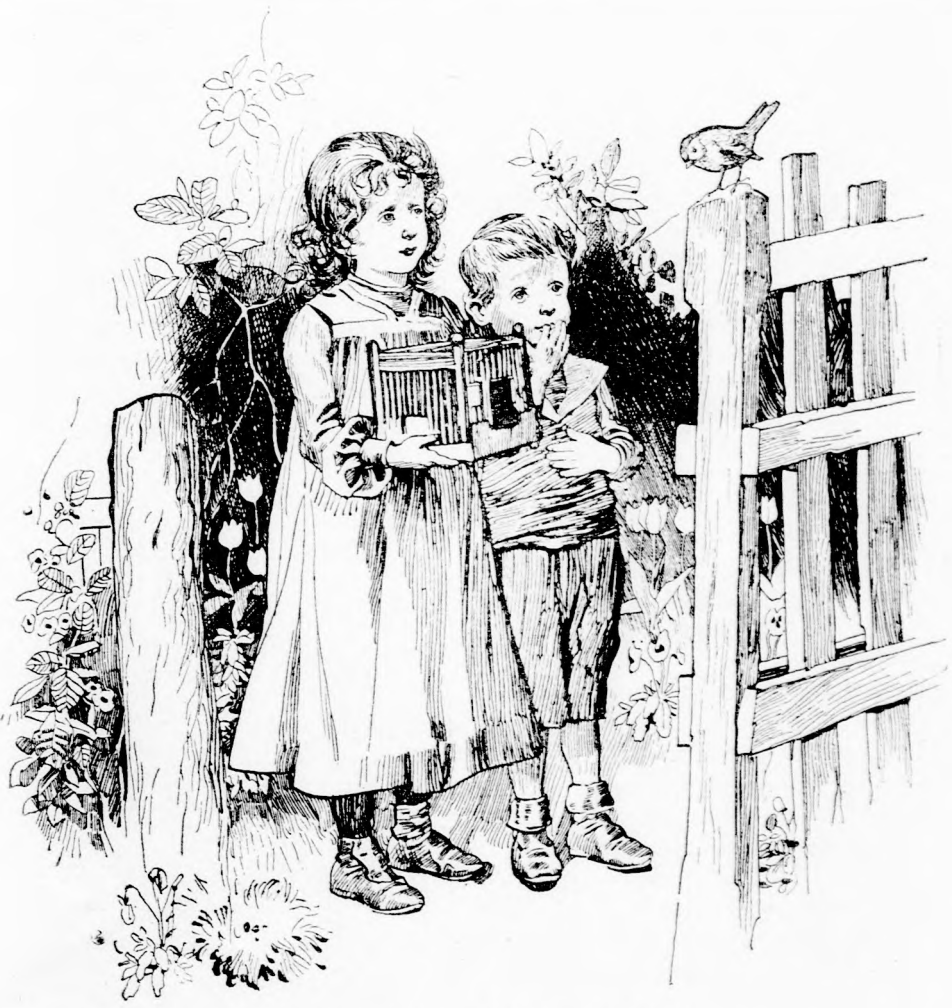
KIS MADÁRKA ... (Lásd a 304. lapon.)