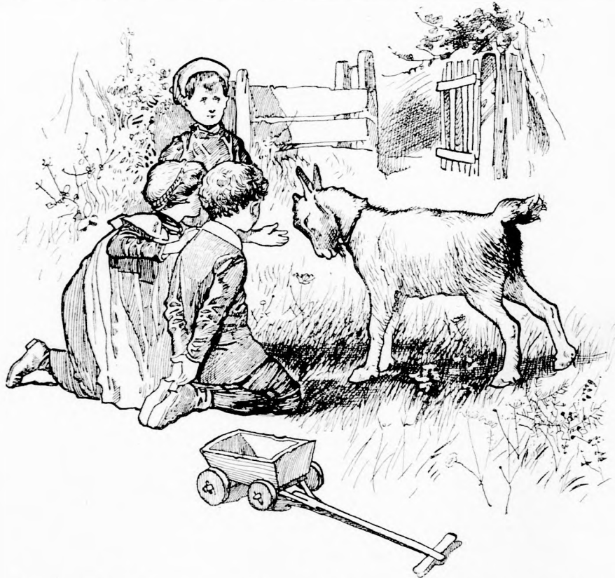
KÖRÜL UGRÁLT BENNÜNKET, KÖZBEN-KÖZBEN MEKEGETT. (Lásd a 311. lapon.)

Abban az időben, amikor ez történt, még nem ismerték a gyujtófát; akkoriban