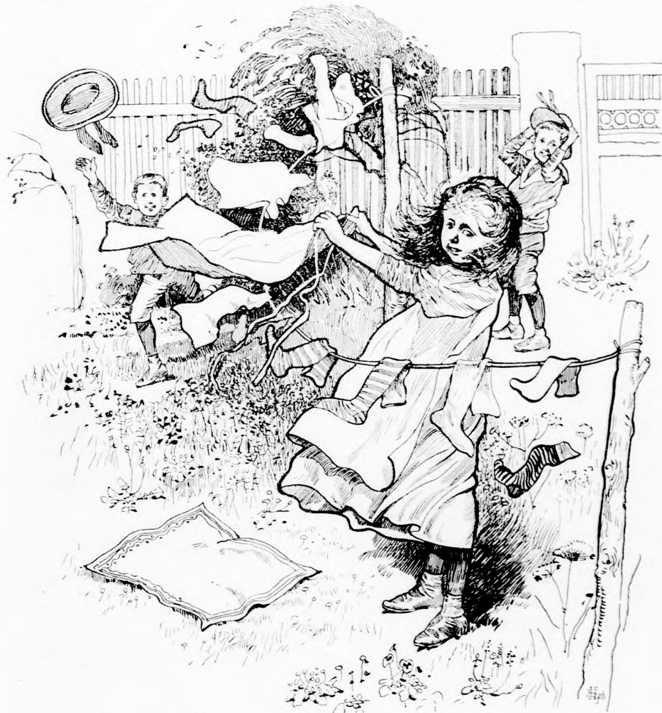
ÁPRILISI TRÉFA. (Lásd a 322. lapon.)