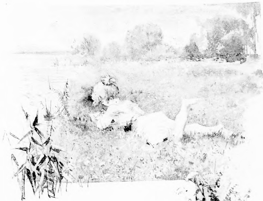
... TAFFI HASRA FEKÜDT A FÜBE S LÁBAIT A LEVEGŐBEN LÓBÁLTA. (Lásd a 324. lapon.)

Az idegen mosolygott. Azt gondolta magában: »Bizonyosan valami nagy csata van valahol, s ez a furcsa gyerek, aki elvette az én büvös cápa-fogamat s még sem pukkad meg, azt akarja, hogy hívjam el segítségül a hatalmas fejedelem egész csapatát. Ő igazán nagy fejedelem, különben észre vett volna.«