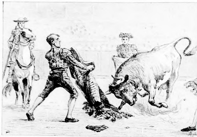
VÖRÖS POSZTÓVAL DÜHÖSÍTIK A BIKÁT.

de azért ők is ujjonganak, lelkesednek, füttyülnek vagy éljeneznek, amilyen oda benn a hangulat. Mind zugóbb lesz a zaj. Lárma, füttyülés, vihogás vegyül el a légben. A esemege- és hűsítő ital-árusok kurjantásai, majd a nézők kiáltásai fokozzák a lármát.