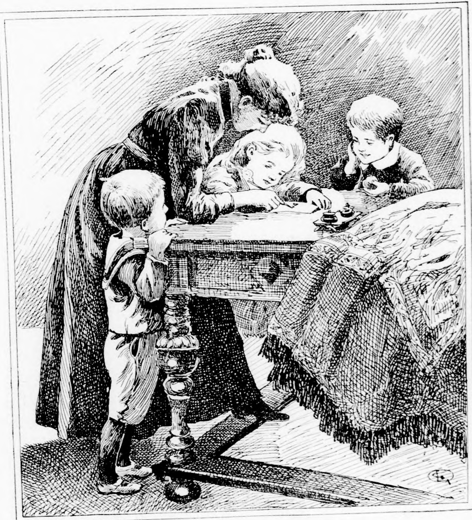
LEVÉL APÁNAK. (Lásd a 117. lapon.)

1903. augusztus 23-án. Ara negyedevre 2 kor. Egyes szám ára 24 fillér. Megjelen minden vasárnap.