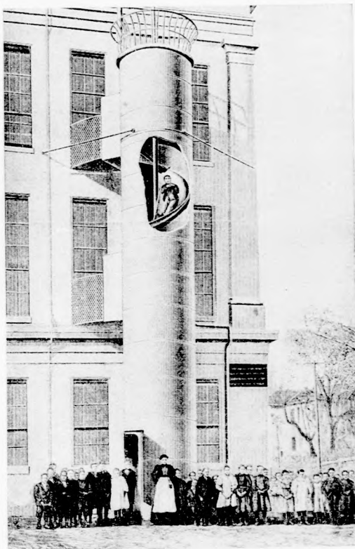
MENTŐ-SIKLÓ TŰZ-VÉSZ ESETÉN.

van, amelybe, ha beletesznek valakit, szépen lecsuszik a földre az ajtóig, ahol sértetlenül kiléphet. Az iskolában minden héten gyakorolgtatják ezt a csuszkalást és a gyermekek nagy örömeiket lelik benne. Tűz esetén néhány perc alatt valamennyi megmenekülhet.