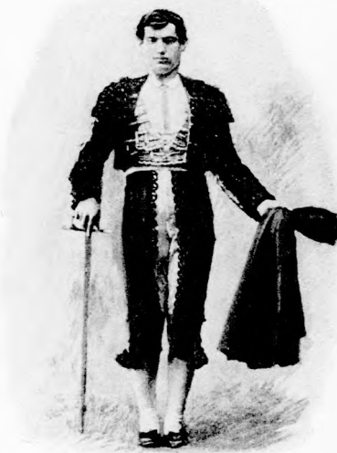
A MATADOR (Bika-ölő.)

áll a matador, aki nyugodtan megy győzni, vagy — meghalni. Ruganyos léptekkel közeledik a bikához. Az óriási közönség harsogó »éljen«-t kiált, majd lecsöndesedik és feszült figyelemmel kíséri minden mozdulatát. Bal kezében kis vörös posztó, jobb-jában hosszú egyenes kard. Ugy játszik az ádáz állattal, mint ha gyermek-játék volna. Most a bika neki ront a posztónak, a matador elkapja előle és másfelől izgatja a bikát, amely fáradhatatlan az öklelésben. A matador most kissé mereven meg-