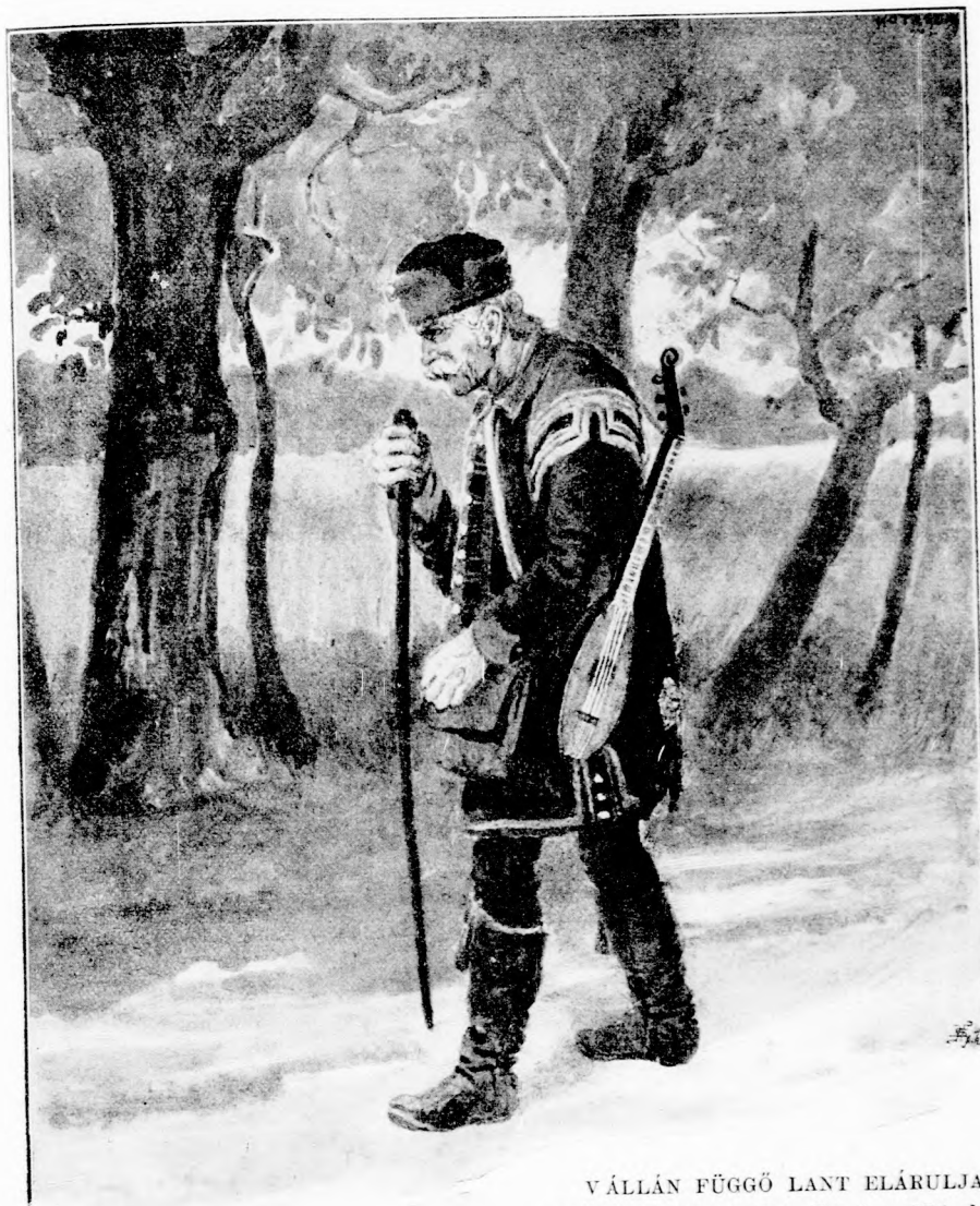
V ÁLLÁN FÜGGŐ LANT ELÁRULJA A VÁNDOR-DALNOKOT. (Lásd a 374. lapon.)

látta, amint egy jól öltözött ifju lovag halálos küzdelmet folytat egy hatalmas mackóval. Oda rohant s kiszabadította a biztos halálból a vadászt. Ez hálálkodva szép művű tört adott atyámnak, azt mondván, hogy menjen föl Budára, mutassa elő ezt a tört s minden kívánsága betelik.