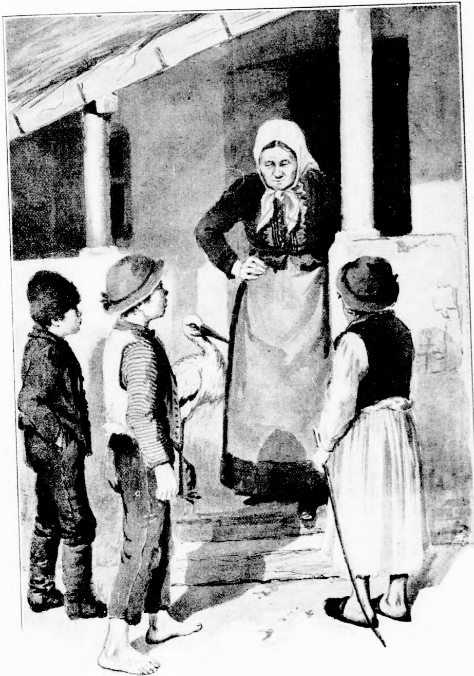
TANÁCSKOZTAK EGYÜTT. (Lásd a 382. lapon.)

bár milyen előkelő nevelésben részesült is, ő bizony nem igen tudta, vagy nem akarta megtanulni, hogy mi a tisztaság. Különben is szörnyen követelő lett a nagy jólétben.