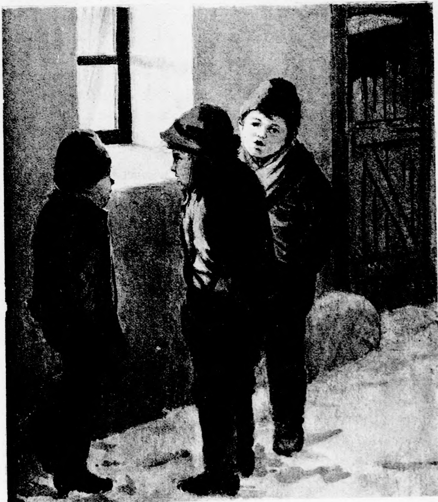
TÉLI KÉP. (Jásd a 26. lapon.)

Ára negyedévre 2 kor. Egyes szám ára 24 fillér. Megjelen minden vasárnap.