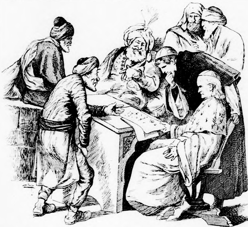
ÉRTSETEK MEG: FÖLNYITJA — HA HALLJA, DE HÁT NEM HALLJA. (Lásd a 47. lapon.)