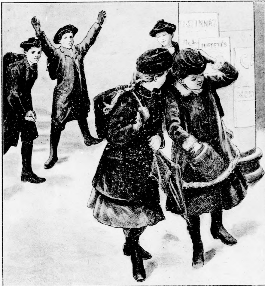
HULL A HÓ. (Lásd a 40. lapon.)