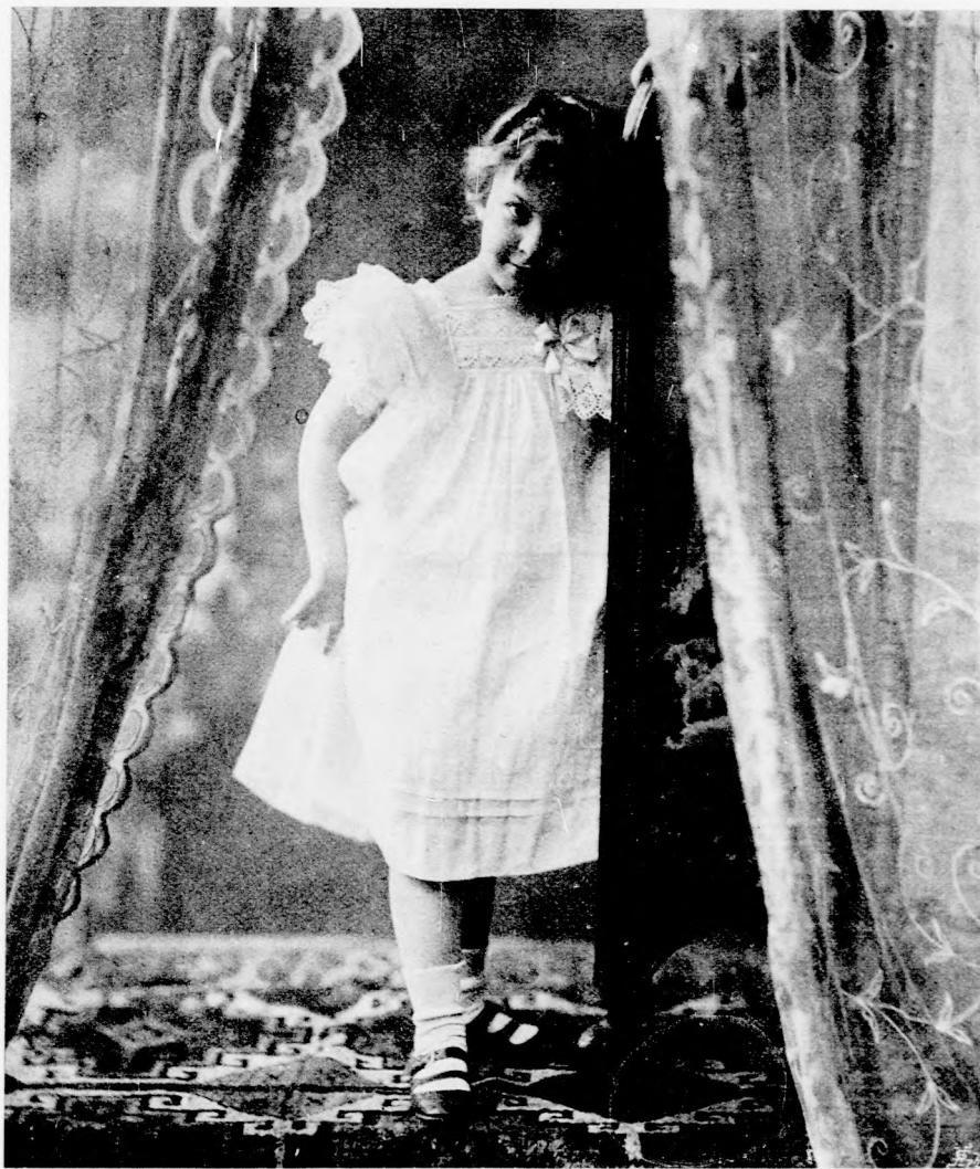
NEHÉZ KÉRDÉS (Lásd a 106. lapon.)

1904. február 14-én. Ára negyedévre 2 kor. Egyes szám ára 24 fillér. Megjelen minden vasárnap.