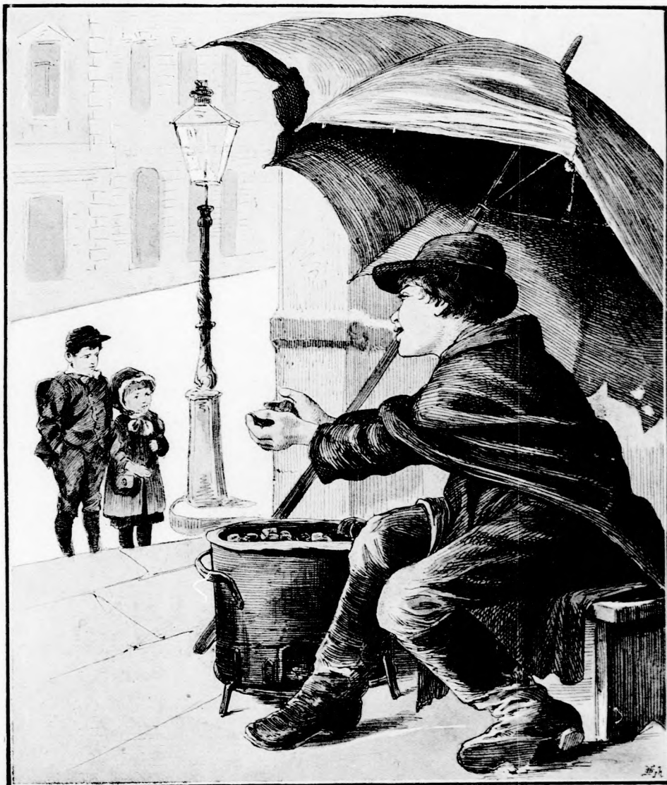
A KIS GESZTENYE-SÜTŐ. (Lásd a 151. lapon.)