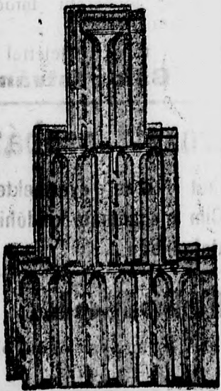
Bohn kikindai cserepe.