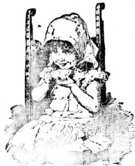
„Mir schmeckt das am besten!“

Wer trinkt Kathreiners Kneipp-Malz-Kaffee?