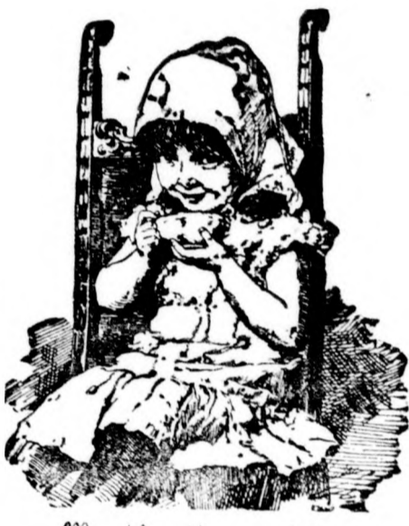
Wir pflegen es am besten!

Wer trinkt Kathreiners Kneipp-Malz-Kaffee?