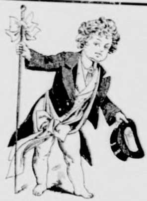
Folyó szám 164.

Nagy választék színházi blousok, felöltők és főkötőkben.