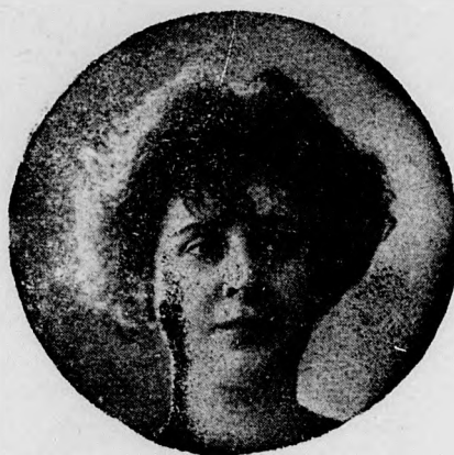
T. C. ig: Böske.

zött a „Három feleség“-ben találjuk meg a legszebb gyöngyöket és úgy dallambőség, mint a technikai készség dolgában kétség- kívül ez az utolsó műve a legértékesebb. S hogy milyen népszerű ez a nálunk még elő sem adott operett, arra nézve talán az a legjellemzőbb, hogy az újdonság ma- gyar zongorakivonatából három hét alatt összesen nyolcz kiadás fogyott el. Az ope-