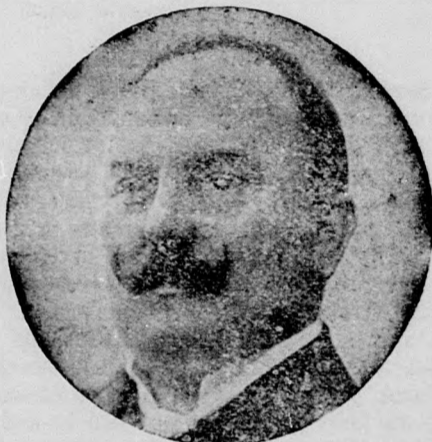
BEJ CZY GYÖRGY

— A Luxemburg grófja Kolozsvárott. A napokban zajlott le a diadalmas új Lehár-operetnek, a Luxemburg grófjának első vidéki bemutatója a kolozsvári Nemzeti Színházban, amely általában először, sőt gyakran a fővárosi színpadokat is megelőzve hozza színre a színpadi irodalom jelesebb termékeit. A bemutatónak olyan hatalmas sikere volt, amely eddig egyedül álló az új