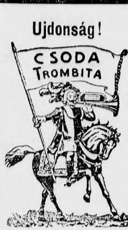
ényképes hangszerárjegyzék ingyen. - Óvás! Figyelem a pontos címre és házszámra

nagy női felöltők áruházában Makón, Fő tér Otthon-kávéház mellett.