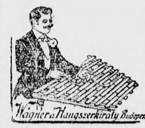
Wagner Hangszerkirály Budapest

országszerte elismert elsőrendű hangszer-áruháza, Budapest, József-körút.