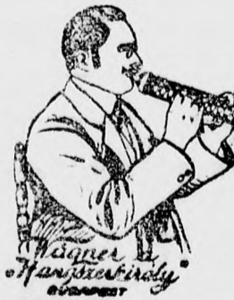
Wagner Hangszerkirály Budapest

Bárki egy óra alatt megtanulhat rajta játszani. A „Varazsfuvola” rendkívül kellemes-20 acél trombitahanggal és 4 erős bőgővel van ellátva. Diszes kivitelben, kofta, fűzettel, dalokkal, tokkal, ajándékkal együtt csak 4 korona. Csakis Wagner „Hangszer-Király” országszerte elismert legolcsóbb hangszeráruházában kapható, Budapest, József-körút 15. — Gyorsjavító mőhely. — Kérjen fényképes hangszerárjegyzéket.