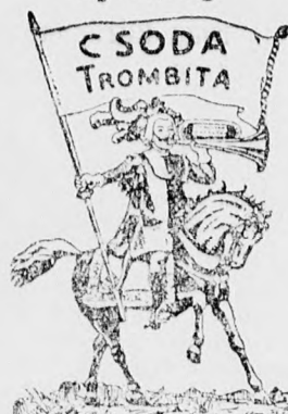
ényképes-hangszerárjegyzék ingyen. - Óvás! Figyelem a pontos címre és házszámra