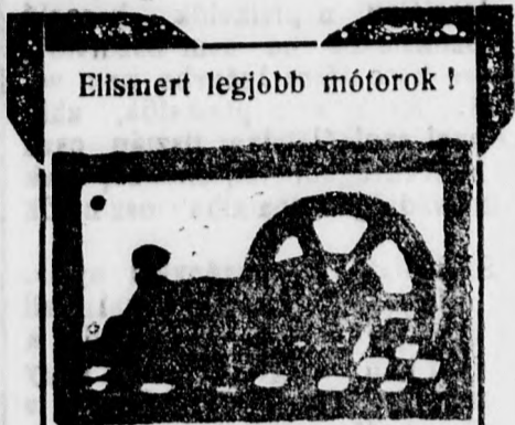
Elismert legjobb motorok!

Világhírű eredeti „Körting” Diesel motorok