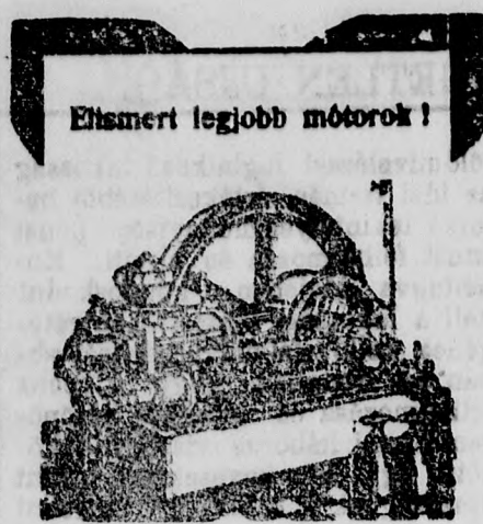
Elismert legjobb motorok!