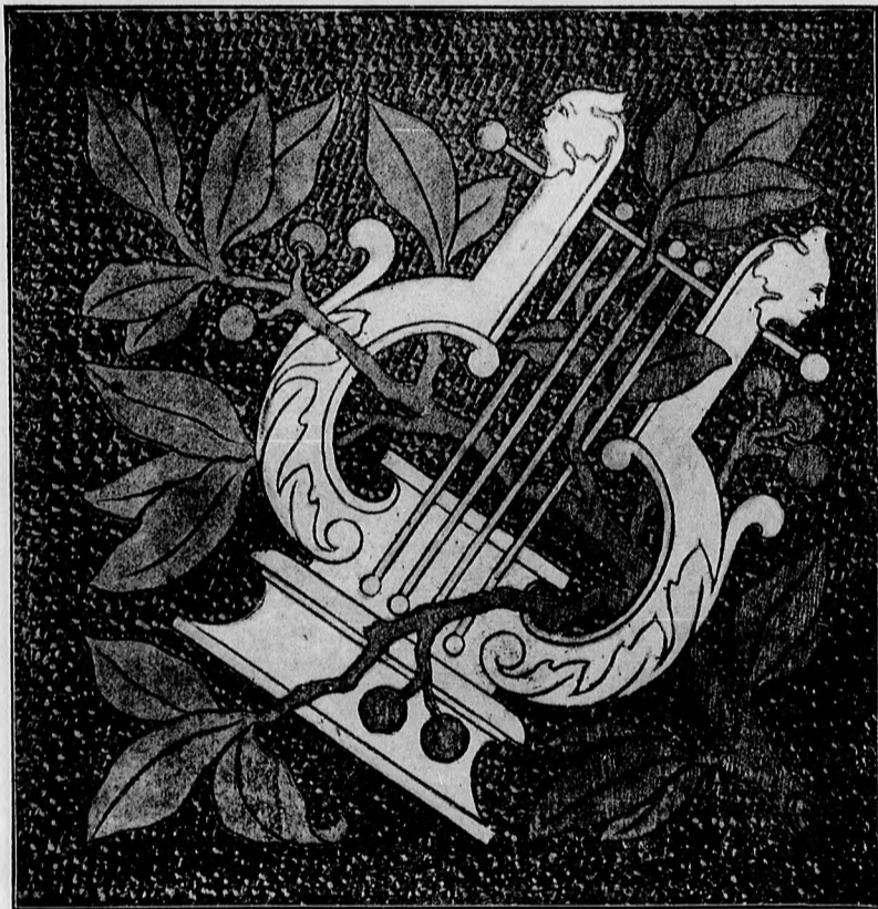
3. sz. Lant. Butorbetét.

Kellemetlen zavart okoz — különösen kezdőknél — a fújtató-lapda repedése. Ez onnét származik, hogy azt hiszik, minél gyorsabban és erősebben fujtatnak kézzel vagy lábbal, annál jobban megy a munka. Pedig a fújtatásnak is bizonyos fordélya van, oly szabályosan kell neki menni, mint a lélekzetvételnek, akkor egyenletes lesz a rajz is. Rövid gyakorlat után a kezdő is belátja ezeket az igazságokat.