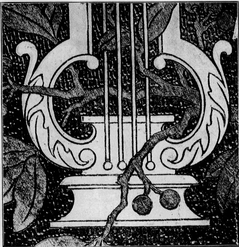
2. sz. Lant. Butorbetét.

Hogy ezt elérhesse, előbb papírra rajzolja a mintát, ezt aztán szorosra a fára ragasztja és mikor megszáradt: tetszés szerinti nagy tüvel (a mit különben a minta és a tárgy is