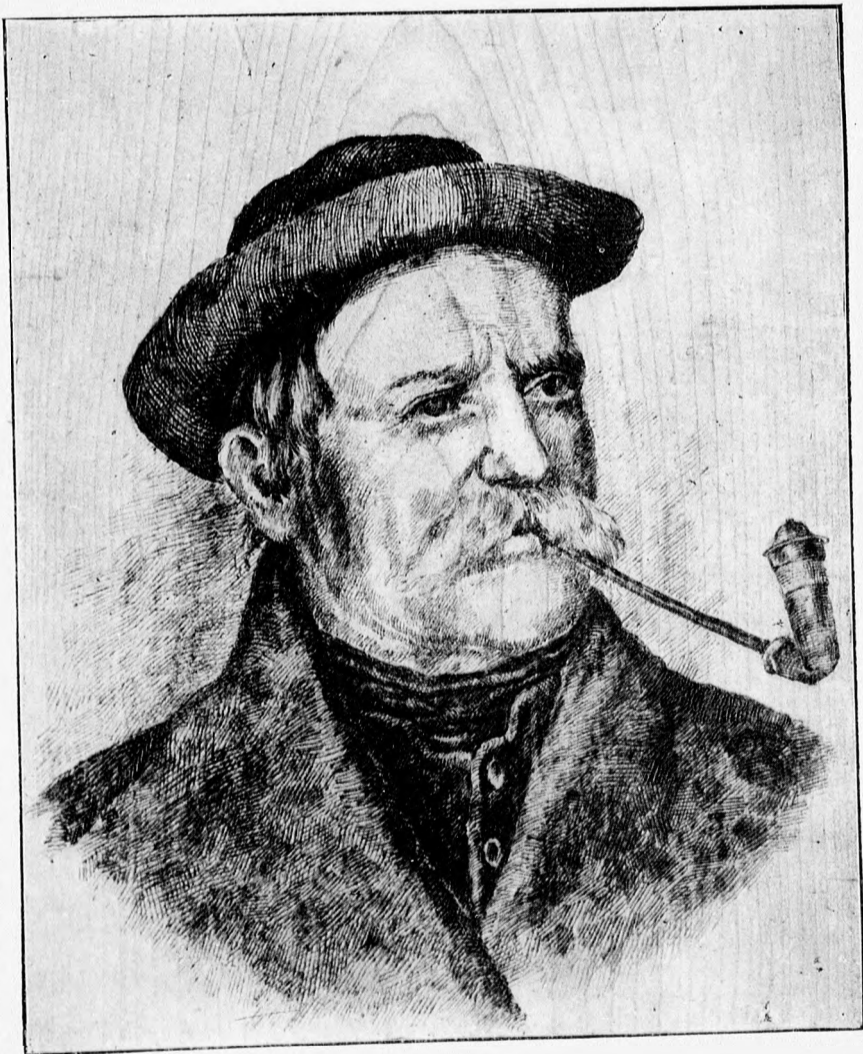
1. sz. Pipázó biró. Faégetés.

Az utóbbi időben az égető-festés (röviden égetésnek mondjuk), rendkívül elterjedt és sok kellemes órát, hasznos foglalkozást szerzett híveinek. Nálunk is mindenütt találkozunk szorgalmas asszonyokkal és leányokkal (nagyobb fiúk is szeretik ezt a fog-