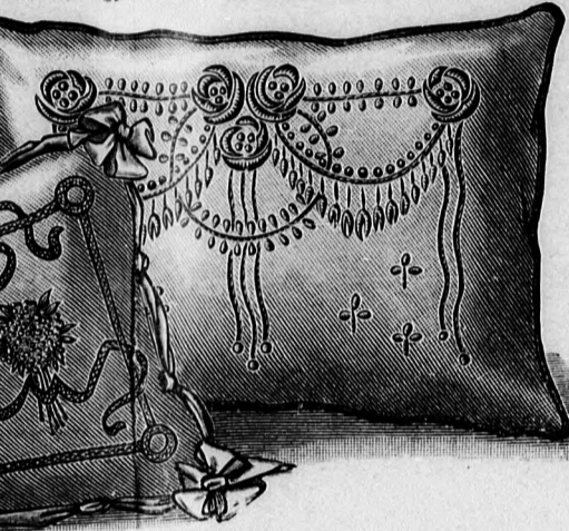
13. sz. Párna. Laposítmás, szővelés.