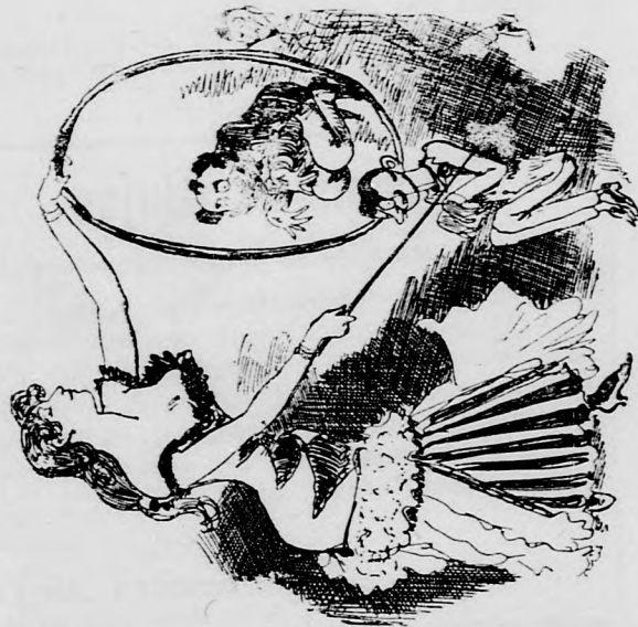
(M. b. ö. r.)