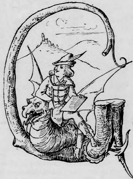
arabonciás Diák a napról.

Iezig az uzsorás. Hallja maga báró ór, mogának van annyi rossz válthója énnálam, hodj nem is merthe maga felé gyönni a Megváltó.