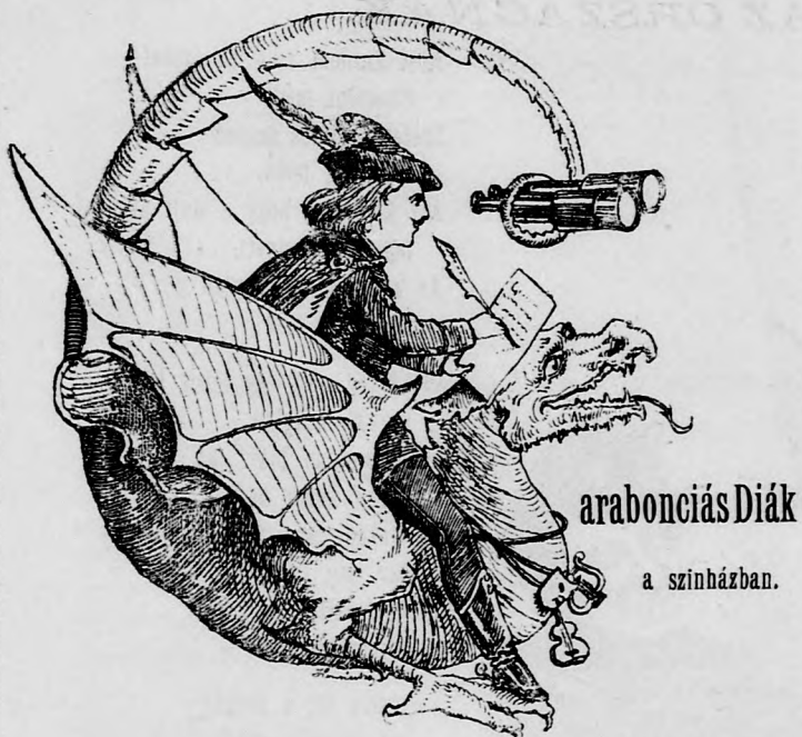
arabonciás Diák a színházban.

Ujabb időben a népszinmű termékek sikerrel igyekeztek egymást felülmulni rosszaságban. Végre jött az „árendás zsidó” s megtörte a jeget. Határozottan jó darab, mit igazolt első előadása alatt is az a folytonos általános tetszés, amely kísérte. Lám, lám, már itt is első helyet kezd foglalni a tót, cigány s többféle nép között a zsidó.