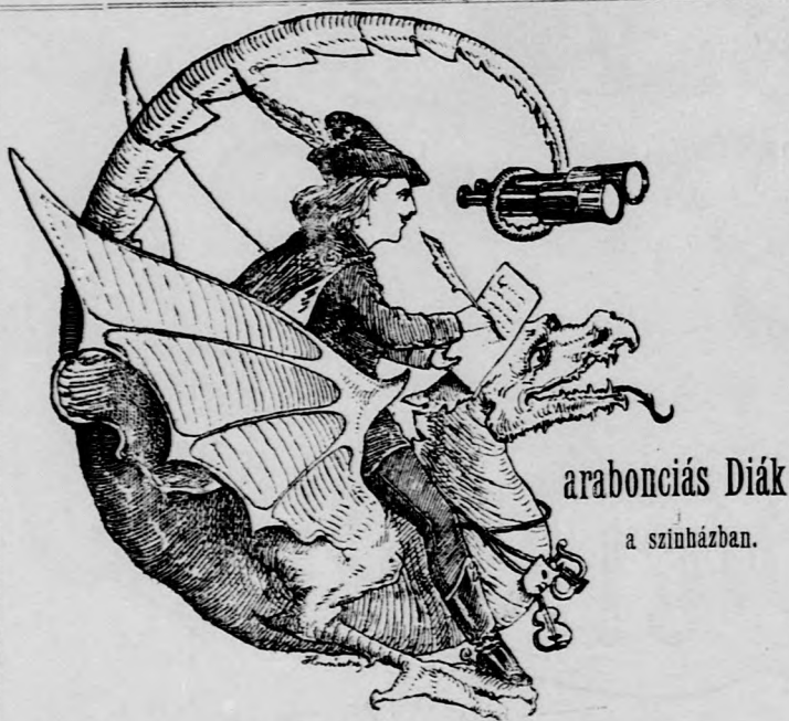
arabonciás Diák a színházban.