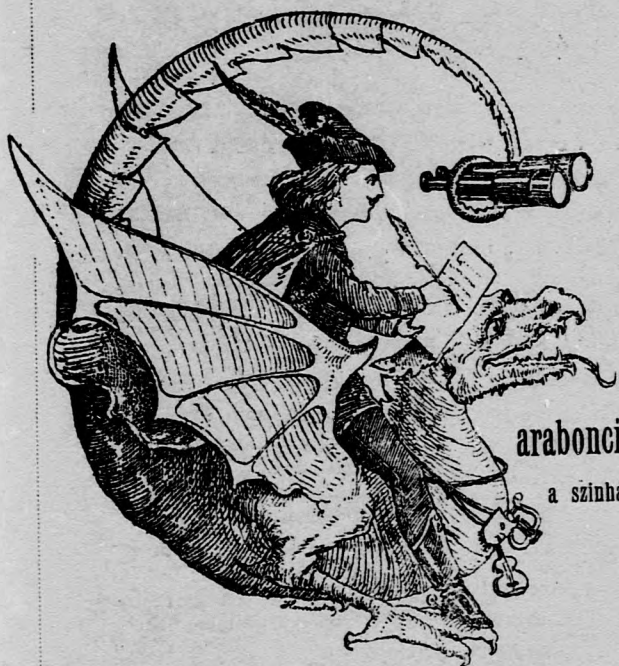
arabonciás D. a színházban.

Káprázatos látvány mutatkozik a látcső előtt. Bűvészet a művészet helyett. Folyton zsúfolt házak emelt helyárcék mellett. No — ugyan fényes bizonyíték azok számára, kik azt állították, hogy Győr magas műveltségű közönségének dráma és vígjáték kell — operett nem! Nemesak operett, de határozott köklerség kell ide. Tessék itt a példa!