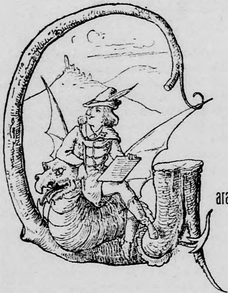
arabonczias D. imitt-amott.

A győri kaszinó választmánya elhatározta, hogy a termeiben zsúfolgó füstöt értékesíti, össze-sajtolja s fűtőszén gyanánt elégeti a télen. Figyelt meztetjük a nemes egyletet, hogy elláthatja az egész várost, ha minden füstöt értékesít.