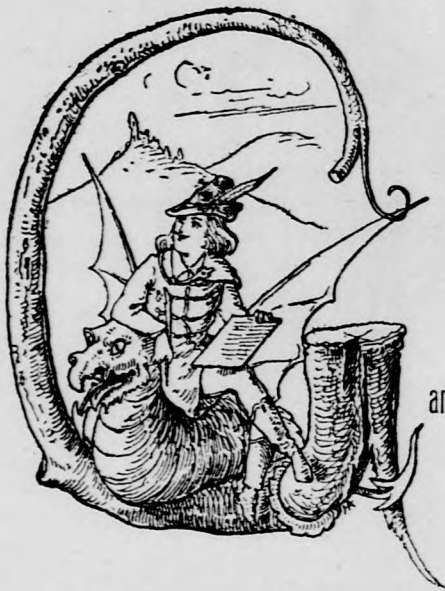
arabonczias D. is itt-amott.

Mióta a baczi llusok elutaztak tőlünk a gyorsvonaton Szegedre, unalmas a világ. Névtelen leveleket is csak minden harmad-negyednap kap az ember! Annyira unalmas, hogy a főkapitány is itt hagyott bennünket, elment szabadságra!