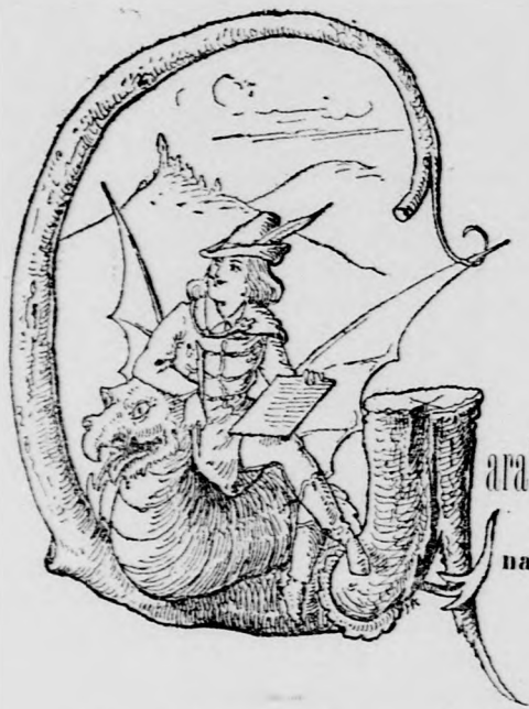
Garabonciás Diák a nagyvilágban.

A muszka czár ideges. Most ideg-rohamban szenved, nemsokára azonban mások szenvednek az ő rohamai alatt.