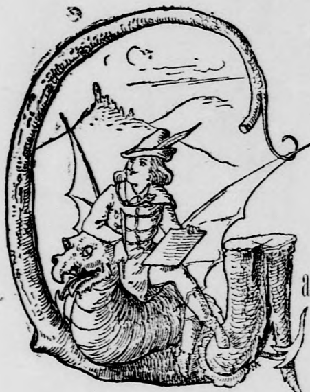
araboneziás Diák a lóversenyen.

Lóvá lett téve egész Győr. Kivonult az egész város a Tákóra s a lovak, lovarok és lovászok művészetében gyönyörködött. Még a czirkuszos sem tartott előadást, a lusta czirkusz-paripák ki mondhatatlan vágygyal kéjelegtek társaiknak gyuródeszkát nélkülöző hátán s nem karikába futó lábain.