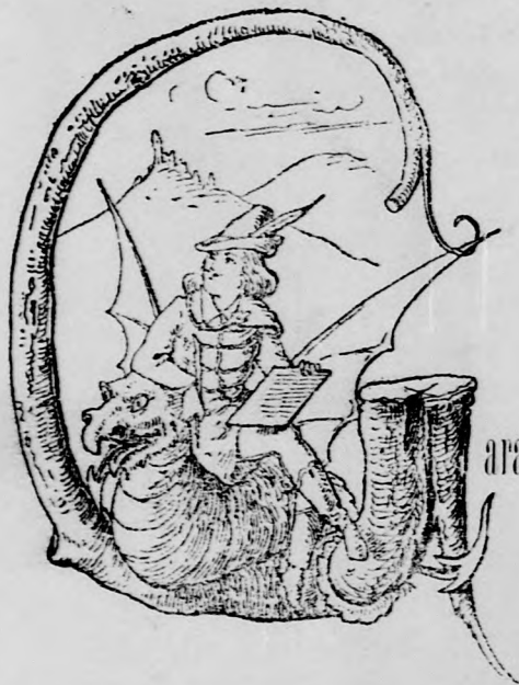
arabonczias Diak a városi közgyűlésen.

Következik a tisztviselői fizetésemelések kérdése.