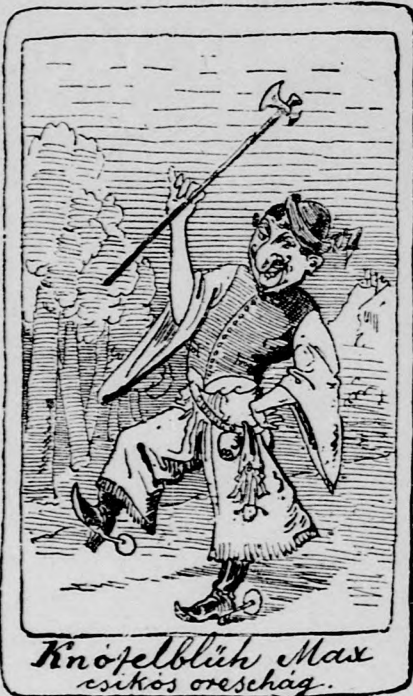
Knöfelblüh Max csikos oroshág.

Sujt az átok, mert szerettelek, Ejjel, nappal érte szenvedek; Sujt az átok és a bánat-ár: Elraboltad szívem nyugalmát.