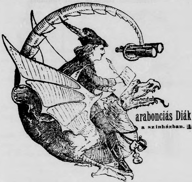
arabonciás Diák a színházban.

Mióta megkezdődött a vendégjárás. Somogyinak a vendégte- len hetekben nincs közönsége.