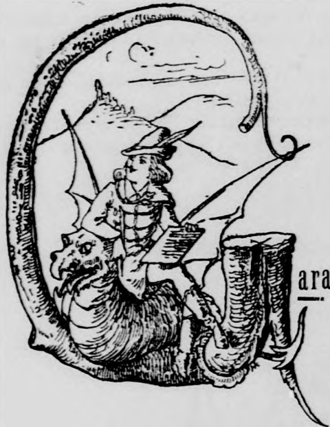
Garabonciás Diák heti krónikája.

— Bolond a zeset nászom. — Ugyan mán mi? — Hát evittem az fiamat köröszttünyi, asztég aszongya az tisztölendő ur, hohhát milészen a zú neve, mondok én nem tom, — aszongya: hát talán jó lesz ha az maga nevit aggyuk neki? Mondok mán ojat csak ne tegyék az tisztölendő ur, mer mi lesz akkor a zén nevem, ha az gyeröknek aggyuk?