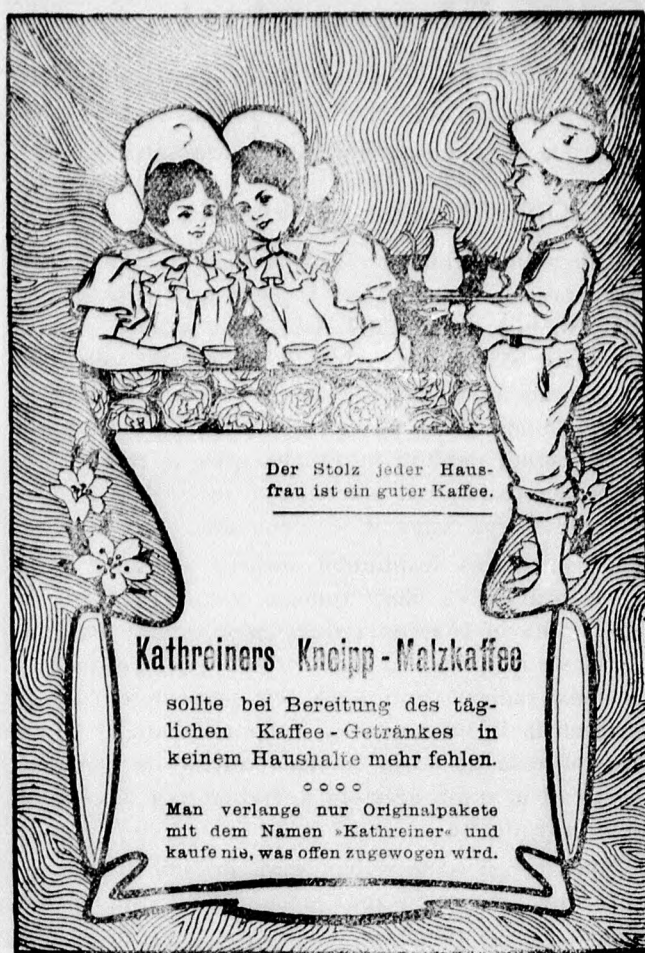
Der Stolz jeder Haus- frau ist ein guter Kaffee.