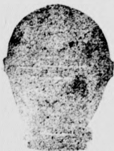
Darabja 70 fillér

légyfogot, mert evékig eltart és nem kell naponta ujítani.