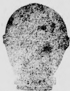
Darabja 70 fillér

OLCSÓSÁGANAL fogva felül mul min- den más