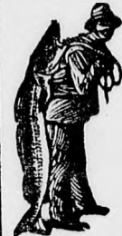
Az Emulsió vásárlásánál — SCOTT féle módszer védjegyét — a halászt — kérjük figyelembe venni

a gyermekek ezen ismert rómét a SCOTT-féle Emulsió minden esetben sikeresen gyógyítja. A SCOTT-féle Emulsió a legjobb ször gyenge, beteges gyermekek gyógyítására, kiknek gyorsan visszaadja