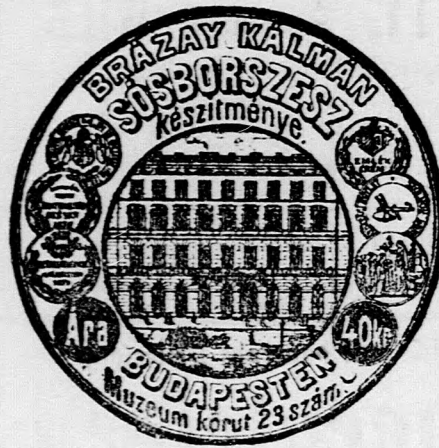
Schutzmarke Nr. 319 und 320.