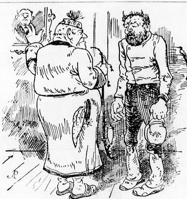
Moderne Banten. Hausbesitzer: „Hausmeister, gehen Sie hinauf zu der neuen Partie, und sagen Sie der Köchin, sie soll augenblicklich mit dem Fleischtopfen aufhören, sonst fällt das Haus noch zusammen.“