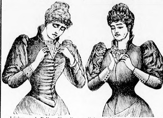
Lücken und Falten überall sitzt noch falten- u. lückenlos wie neu

Taille mit seitherigen Hafteln Taille m. Prym's Reform-Hafteln nach nur 1 Wochen langem Gebrauch. Taille nach über 6 Monate langem Gebrauch.