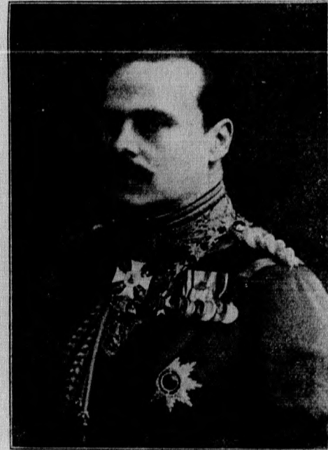
Großherzog Ernst Ludwig von Hessen.

(Mit Text.)