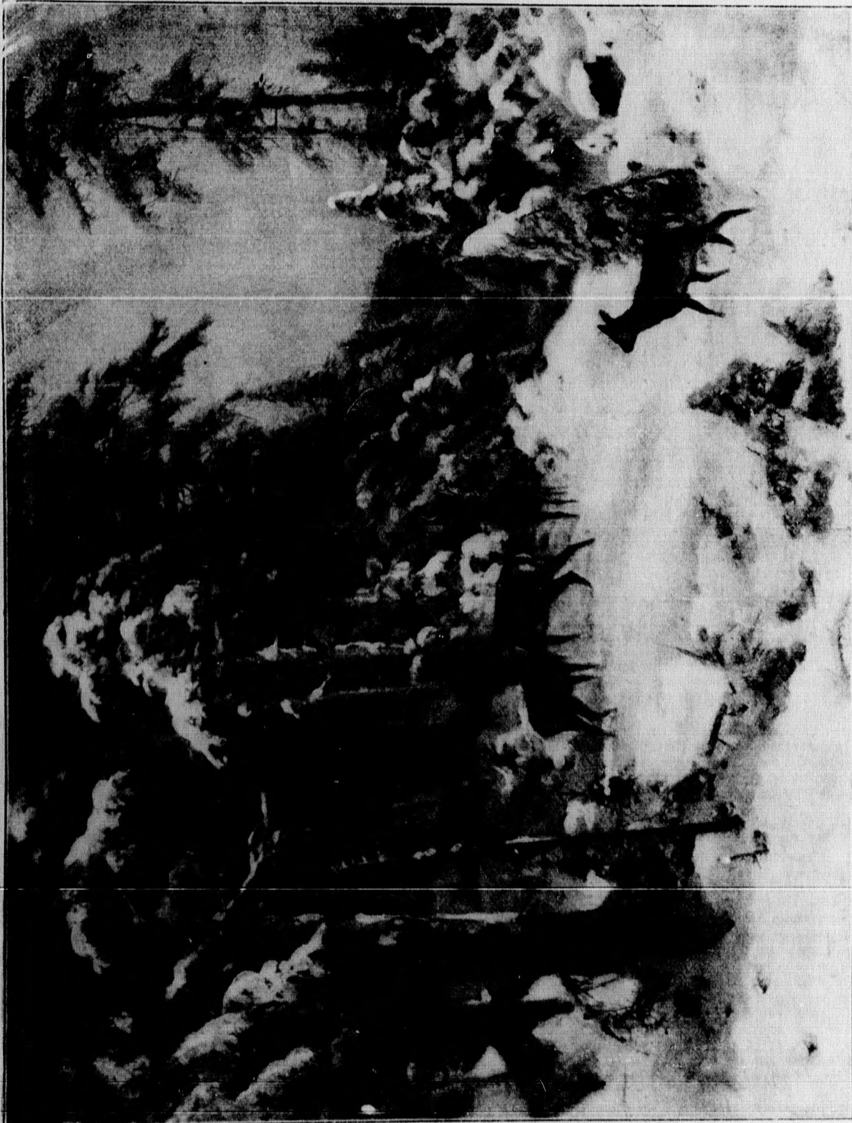
Schneewald im Winter. Von G. F. Hiele. Mit Text.

„Was ist's, bester Christian, — ich beschwöre dich —“ „Nun, nun, noch ist's ja nicht zu schlimm, aber man muß euer gleich vorbeugen.“