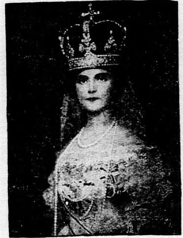
3. számú kép.

Zita királyné Ófelsége arcképe, koronázási ruhában, a koronával a fején. Népies, olesó kiadás, mélynyomású kivételben. Ófelsége a királyné aláírásának fakszimilijével. A kép nagysága 40/50 cm., a fehér keret (margó) szélessége 15/20 cm., tehát a műlap teljes nagysága 55/70 cm. Ára 6 kor., 5 cm. széles tölgyfakeretben 35 korona.