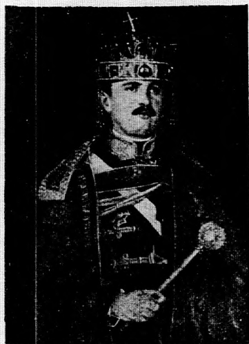
2. számú kép.

A befolyó összes tiszta jövedelmet a Hadsegélyező Hivatal özvegy- és árva-alapja javára fordítja a Szent-István-Társulat.