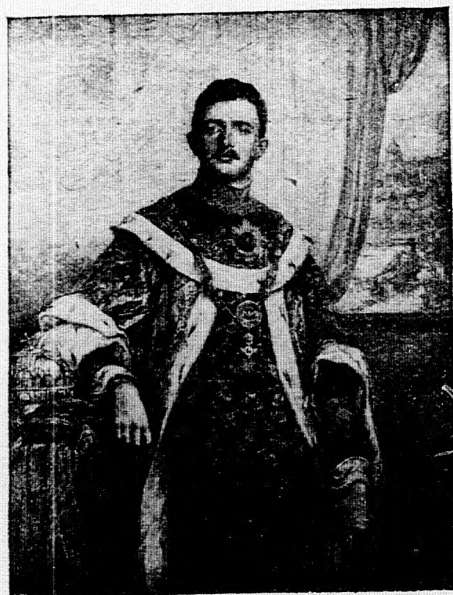
1. számú kép.

Budapest, VIII., Szentkirályi-utca 28-30.