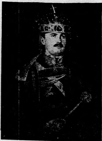
2. számú kép.

A befolyó összes tiszta jövedelmet a Hadsegélyező Hivatal özvegy- és árva-alapja javára fordítja a Szent-István-Társulat.