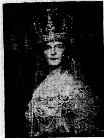
3. számú kép.

Ugyanez rézfénynyomat (kézi nyomás) kiadásban. Ófelsége a királyné aláírásának fakszimilijével. A kép nagysága 40,50 cm., a fehér keret (margó) szélessége 20,30 cm., tehát a műlap teljes nagysága 60,80 cm. Ára 20 korona, 8 cm. széles tölgyfakeretben 86 korona.