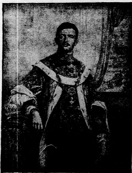
1. számú kép.

Budapest, VIII., Szentkirályi-utca 28-30.