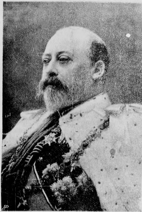
König Eduard VII. von England.

Wie wenig die äußerste Linke geneigt ist, Nachgiebigkeit und Selbstverleugnung zu üben, beweist das Desaveu, das sie Herrn Day bereitet hat. Als dieser nämlich kürzlich in seinem Wahlbezirk erklärte, man müsse, auch wenn die ungarische Dienst- und Kommandosprache nicht gewährt, aber die übrigen nationalen Forderungen erfüllt werden, die Obstruktion einstellen, hat das Inquisitions-Tribunal die Verdammung dieses „Abtrünnigen“ ausgesprochen. Zugleich wird aufs bestimmteste kundgethan, daß die Krone Alles bewilligen